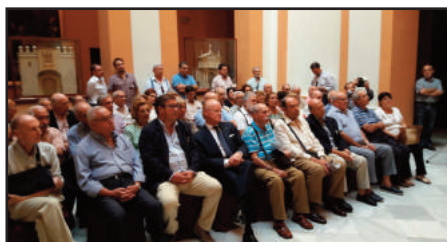
Parte del público asistente.