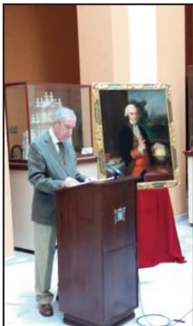
Intervención de nuestro Presidente.