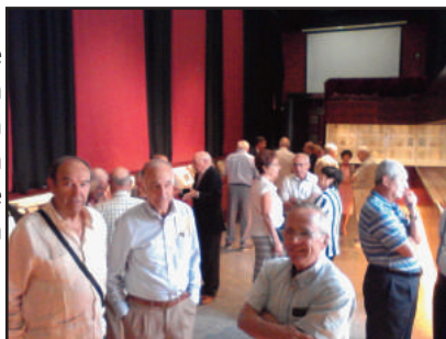
Visitas comentando las colecciones.

Esperamos poder repetir este año el acontecimiento y dedicar la misma a los 25 años de la Exposición Universal EXPO '92, para lo que ya contamos con la aportación de coleccionistas miembros de nuestra asociación.