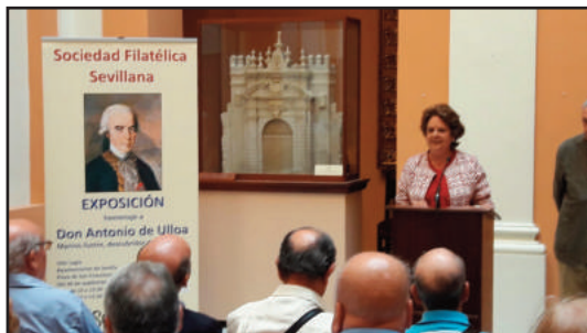
Palabras de bienvenida de la Primer Teniente de Alcalde.

El pasado día 26 de septiembre a las 12 horas, en el Ayuntamiento de Sevilla, y organizada por la Sociedad Filatélica Sevillana, se inauguró la Exposición Filatélica homenaje a Don Antonio de Ulloa coincidiendo con la emisión del sello.