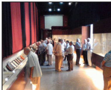
Visitas comentando las colecciones.